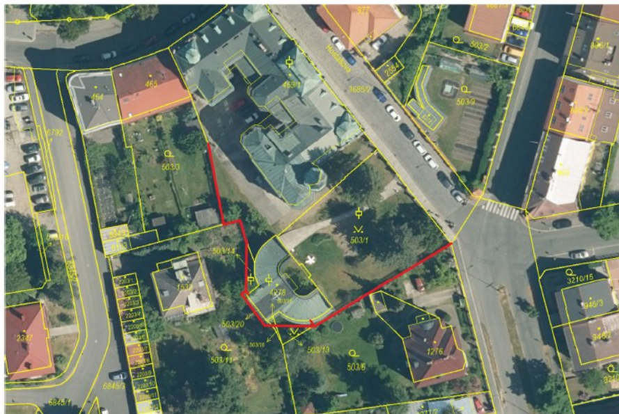
Příloha č. 1 - Mapa